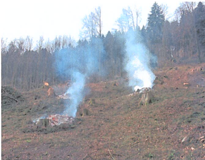
Im Winter verboten: Verbrennung von Schlagabraum.